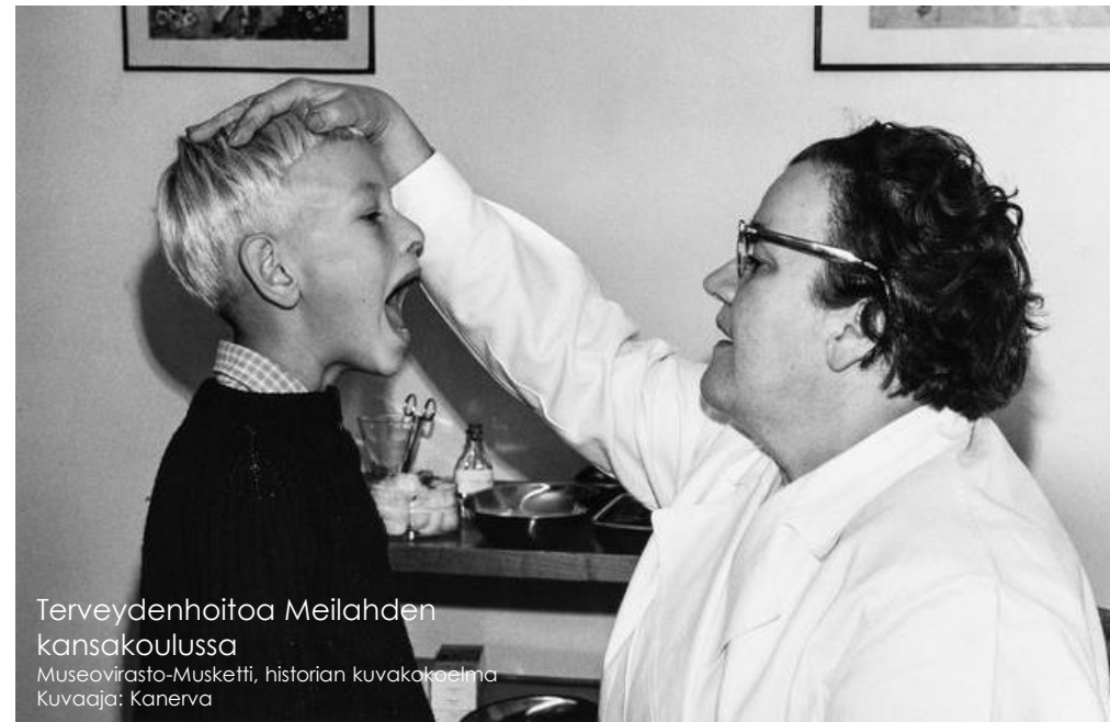
Terveystoimintaa Meilahden kansakoulussa