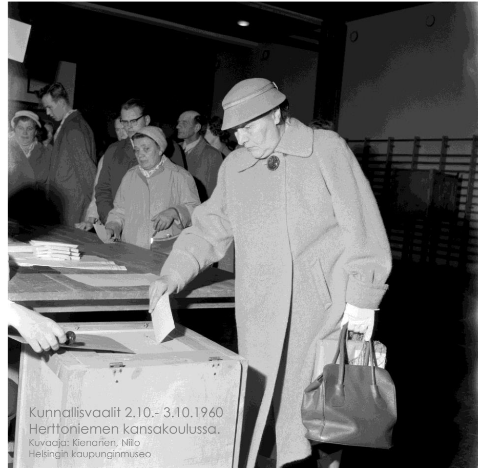
Kunnallisvaalit 2.10.- 3.10.1960 Herttoniemen kansakoulussa.