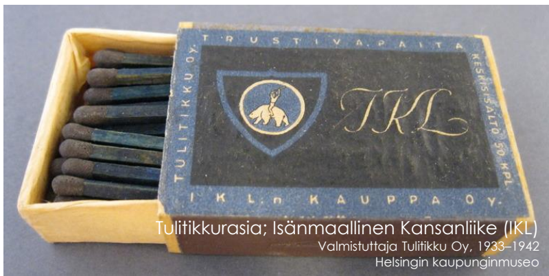
Tulitikkurasia; Isänmaallinen Kansanliike (IKL) Valmistuttaja Tulitikki Oy, 1933–1942 Helsingin kaupunginmuseo